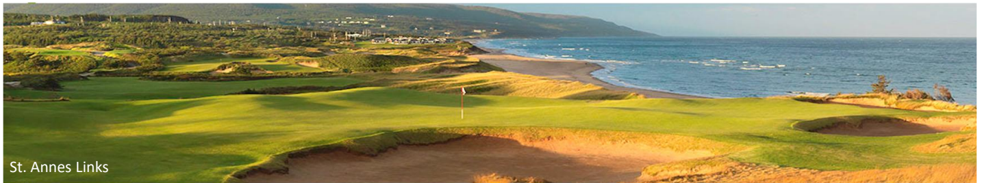
St. Annes Links

Palmerstown House ist einer der „must play“ Plätze Irlands. Dieser außergewöhnliche Platz wurde von Christy O'Connor Jnr. entworfen und bietet Golfern auf einigen der besten Fairways und Grüns Irlands zu spielen. St Annes Links ist ein 18-Loch Platz inmitten des Bull Island Naturschutzgebietes der Dubliner Bucht. Der Platz ist sehr anspruchsvoll und die Landschaft beeindruckend. The K Club Palmer North & South Course zählen zu den besten und schwierigsten in Irland. 2006 wurde auf dem North Course der RyderCup ausgetragen. Corballis - Dieses Juwel der irischen Links-Familie mit atemberaubenden Ausblicken auf die Küste im Norden Dublins bietet eine einzigartige Golfherausforderung für alle Spielstärken.